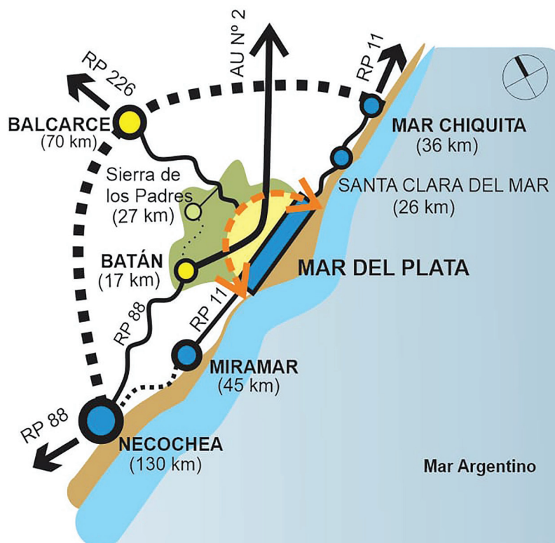
Figura 1. Paisaje protegido Mar y Sierra 2.0. Elaboración propia.