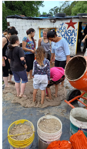
Figura N° 2 Jornada comunitaria para la creación de un horno de barro en la vivienda de una vecina del Barrio Las Dalias, que funcionaba como casa vecinal. Diciembre de 2021 .

Si bien estas prácticas permitieron construir lazos comunitarios y fortalecer referencias vecinales, los espacios a los que se trasladaron —principalmente viviendas particulares, en situaciones de precariedad— no contaban con las condiciones necesarias para albergar las actividades que comenzaron a sostener, entre ellas el apoyo escolar, que se constituyó en una instancia fundamental de acompañamiento y contención para las infancias del barrio.