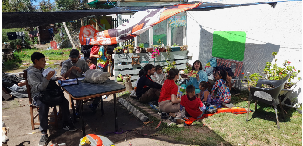
Figura N° 4 Jornada de apoyo escolar y merienda en la vivienda de una vecina del Barrio Las Dalias, que funcionaba como casa vecinal. Octubre 2024.