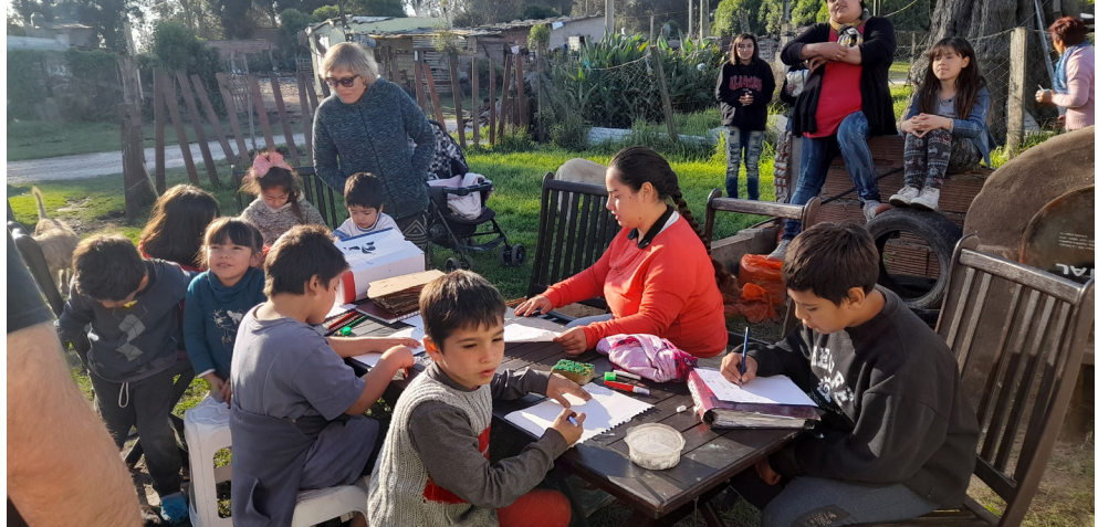
Figura N° 3 Jornada de apoyo escolar y merienda en la vivienda de una vecina del Barrio Las Dalias, que funcionaba como casa vecinal. Abril 2022.

La organización de estas actividades en espacios domésticos reveló tanto la capacidad de adaptación y solidaridad comunitaria, como los límites físicos y materiales del entorno barrial, poniendo en evidencia la necesidad de contar con equipamientos sociales adecuados. Esta situación se consolidó como un antecedente clave para el surgimiento del proyecto Hacemos Plaza, que reconoce en esas experiencias previas la urgencia de construir colectivamente espacios públicos que garanticen condiciones dignas para el encuentro, el aprendizaje y el cuidado.