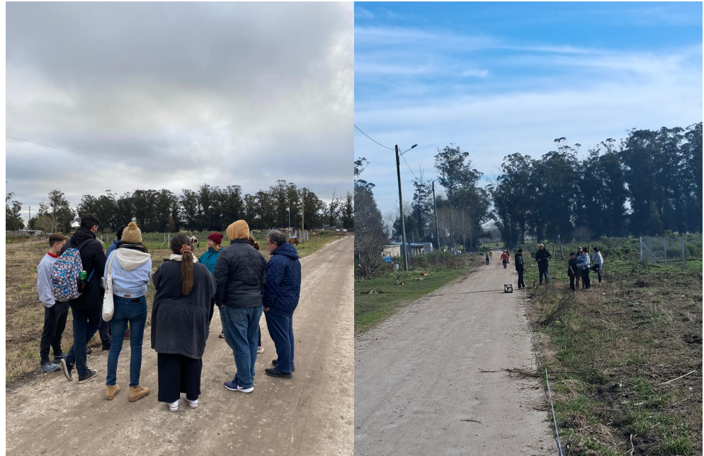
Figura N° 6 y 7 Primera Asamblea Barrial en la Plaza, con la participación de los vecinos del barrio, voluntarios de la actividad de Extensión Hacemos Plaza e integrantes de Patria Grande. Julio 2025.

La ubicación de la futura plaza, situada en un ámbito de borde entre lo urbano y lo rural, no solo debe responder a las características físicas del territorio, sino que también adquiere relevancia social y simbólica. Al situarse en esta zona de transición, el espacio y fundamentalmente el proceso de hacer del mismo tiene el potencial de construir nuevas referencias barriales, funcionando como un punto de encuentro para quienes habitan sectores históricamente desconectados del centro comunitario del barrio.