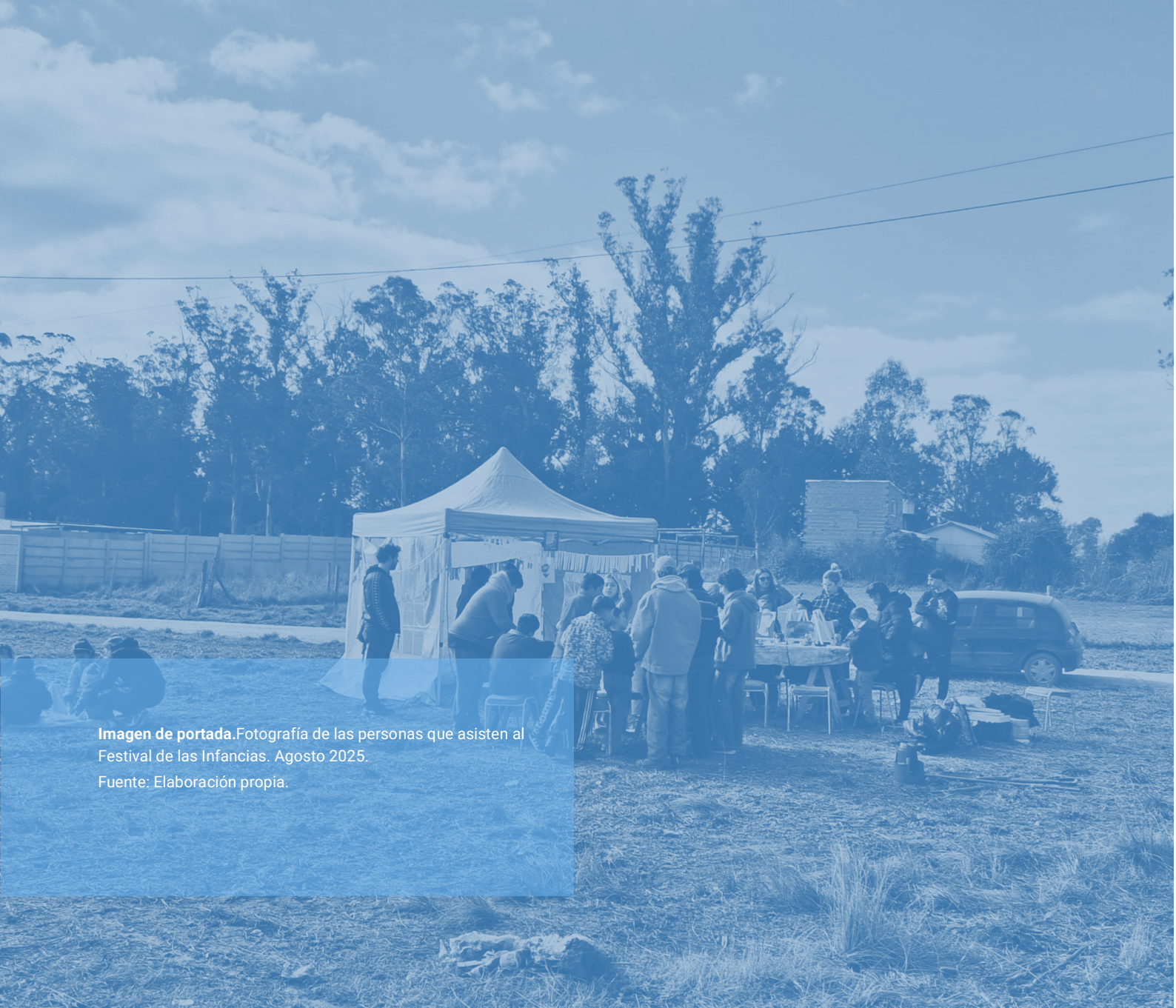
Imagen de portada. Fotografía de las personas que asisten al Festival de las Infancias. Agosto 2025.