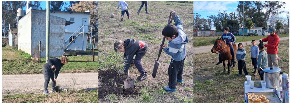
Figura N° 10,11 y 12 Vecina del barrio haciendo mantenimiento de la plaza durante el Festival de las Infancias. Niñxs del barrio haciendo el pozo para colocar el cartel de la plaza durante el Festival de las Infancias. Niñxs del barrio esperando la merienda durante el Festival de las Infancias. Agosto de 2025.

El equipo de estudiantes de sociología desarrolló el instrumento para el relevamiento de oficios y habilidades locales. Este relevamiento de oficios y capacidades tiene como objetivo servir como base estratégica en el proceso de autoconstrucción asistida de la plaza. Este será una herramienta de diagnóstico que nos permitirá identificar saberes existentes para así poder asignar roles y planificar las capacitaciones necesarias.