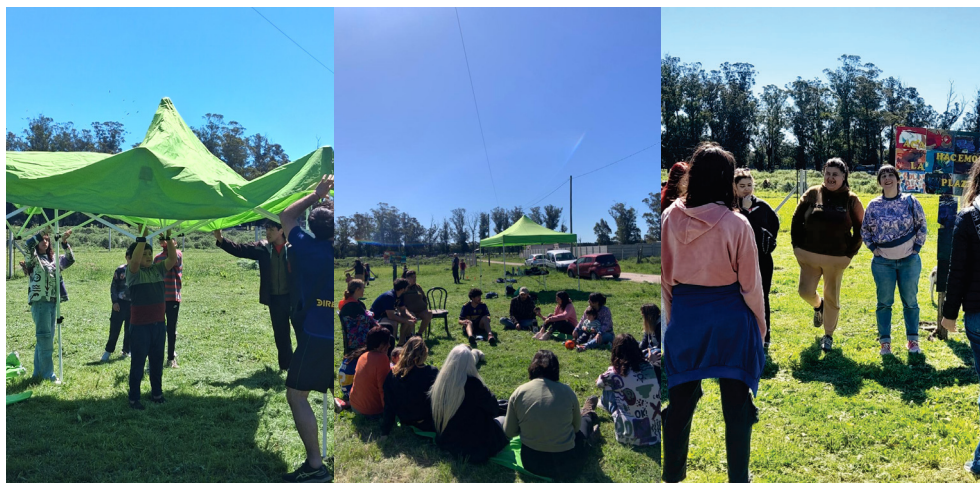
Figura N° 16,17 y 18 Voluntarios y vecinos armando el gazebo para la jornada en que se trató el proyecto de ordenanza de la plaza. Tratamiento del proyecto de ordenanza de la plaza entre los integrantes de Hacemos Plaza, la Organización Patria Grande y el grupo de concejales de Unión Por la Patria Mar del Plata. Cierre de la jornada para el tratamiento del proyecto de ordenanza de la plaza al lado del cartel realizado durante el festival de las infancias. Octubre de 2025.

Durante las jornadas en la plaza se integraron también talleristas de arte, un grupo del Centro Cultural América Libre, y un profesor de educación física. Estas articulaciones amplían el sentido pedagógico de la experiencia, transformando el espacio público en un territorio educativo, donde se ensayan nuevas formas de aprender y enseñar desde la práctica social.