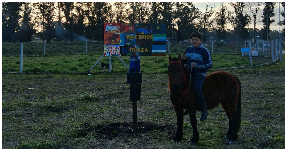
Figura N° 20 Imagotipo. Autoría del equipo de trabajo de hacemos plaza.