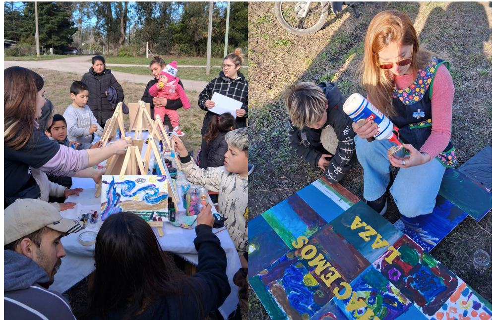
Figura Nº 8 y 9 Niños pintando las partes que compondrán luego el primer cartel de la plaza durante el Festival de las Infancias en la plaza. Tallerista de arte junto a uno de los niños del barrio ensamblando el cartel de la plaza durante el Festival de las Infancias en la plaza. Agosto de 2025.

El festival materializó la idea de que el espacio público se construye por apropiación, tal como señalan Lewkowicz y Sztulwark (2022); retomando a Louis Kahn: