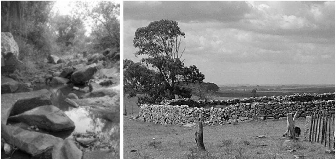
Fig. 4. El paisaje