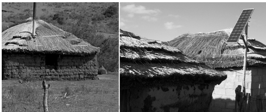
Fig.3. El saber hacer arquitectónico.