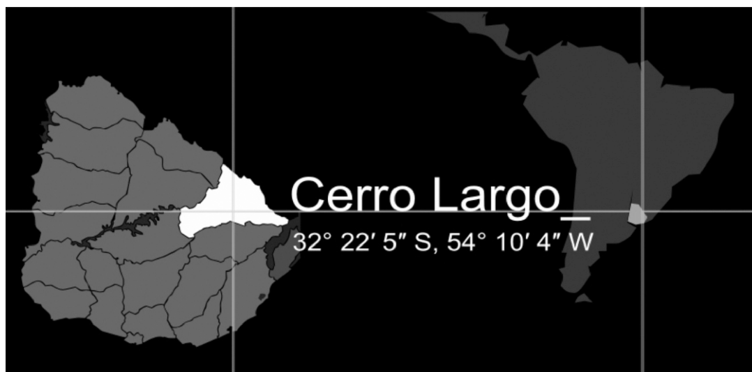
Fig.2. Mapa de ubicación