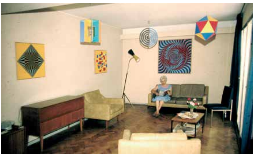
Fig. 2. AbdulioGiudici, Interior de su casa, pueden apreciarse diseños y piezas artísticas de las décadas 50 al 70