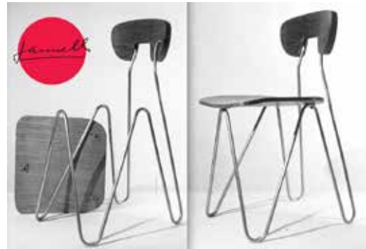
Fig. 16. Silla W de César Jannello década 40-50

y Fundación del Interior trabajan de manera conjunta en los aspectos vinculados a la investigación (fig. 16).