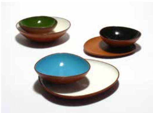
Fig. 15. COLBO, vajilla reeditada