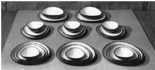
Fig. 14. COLBO diseño de vajilla Colette Boccara, década 50

El proyecto realiza un aporte a la demanda de vajilla gourmet en el país y propone una actualización comercial que ayuda a generar puestos de trabajo y a continuar con la investigación y el desarrollo del diseño. Colbo y Fundación del Interior trabajan juntos en los aspectos de protección patrimonial y en la creación de renovados proyectos de vajilla cerámica. (fig. 14 y 15)