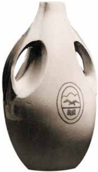
Fig. 3. Aceitera para oliva. Diseño José Carrieri - Escuela de cerámica

anclaje en el ámbito del debate acerca de las producciones contemporáneas. Por esta razón, se constituye una colección más amplia que se extiende hasta el período moderno, específicamente hasta la década del cincuenta. Se trata de una ampliación del arco temporal de colección que permite construir redes de sentido, trazar conexiones, definir lineamientos estéticos y reconstruir períodos histórico-culturales. La selección de obras incluye a