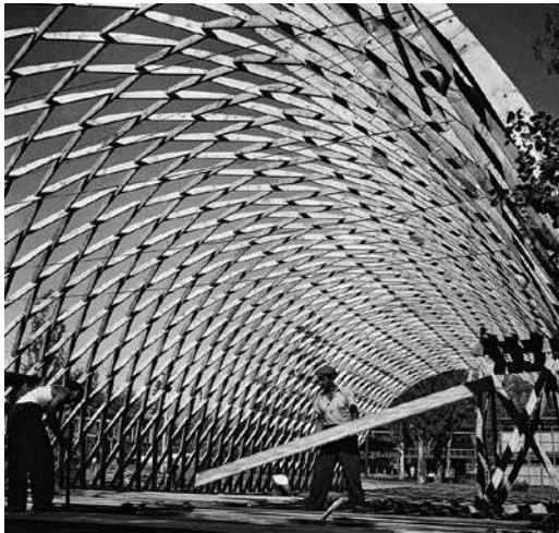
Fig. 8. Pabellón de Chile, Feria de América 1953-54