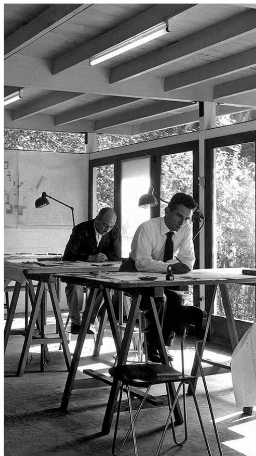
Fig. 6 .Oficina administrativa. Feria de América 1953-54

Se trata de una publicación sin precedentes en Mendoza que investiga las producciones artísticas de las últimas décadas seleccionadas en base a sus aspectos de renovación con relación a las obras artísticas legitimadas por los circuitos oficiales que ponderan prácticas y estéticas tradicionales en el medio local. Algunas obras fueron recuperadas del abandono y de la destrucción. El libro cuenta con páginas ilustradas a todo color con obras de artistas, de grupos y de sucesos artísticos de la escena local. Contiene un texto que reconstruye el panorama local y crea una trama política, cultural y económica con la que interactúan los artistas y sus obras en diferentes momentos