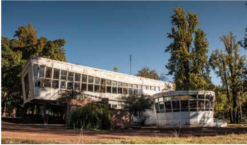
Fig. 7. Pabellón 24. Feria de América