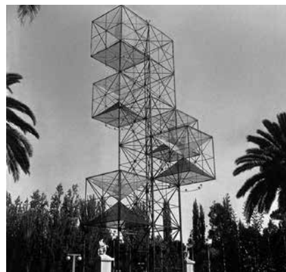
Fig. 11. Torre apertura