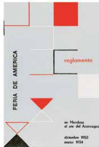
Fig. 9. Reglamento