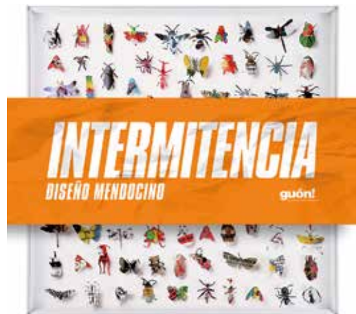
Fig. 13. Intermitencia, próximo libro Fundación del Interior

La reedición de Colbo apuesta a la innovación apoyada en el uso de nuevas tecnologías para dar continuidad a la herencia moderna.