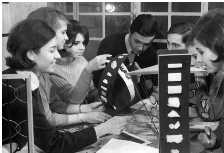
Fig. 4. Clases de Visión, Dpto de Diseño, UNCuyo (1962)