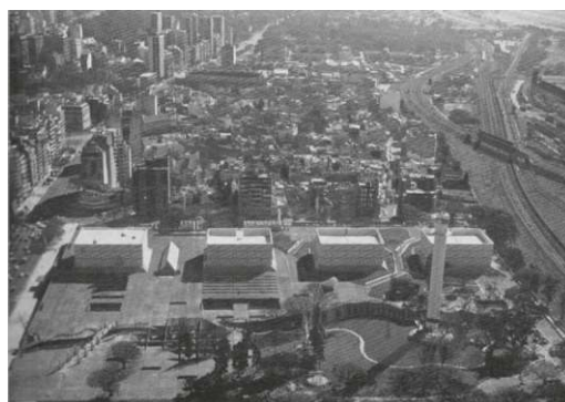
Fig. 2. Vista aérea del Centro de Producción Buenos Aires y su entorno (1978. Summa, 127)

por la avenida Figueroa Alcorta, las calles Tagle y Austria y las vías del ferrocarril Mitre. No se llamaba Argentina Televisora Color, ni aún Canal 7. 2 Su construcción fue veloz, en sólo 18 meses, entre 1977 y 1978, con un comitente apremiado por la televisación a color del encuentro futbolístico que se realizaría en nuestro país en junio de 1978 y que la Junta Militar pretendía utilizar para mejorar su imagen ante la supuesta campaña antiargentina que se estaba desarrollando en el exterior. Se trataba, en realidad, de las denuncias sobre las violaciones a los derechos humanos que habían comenzado a circular cada vez con mayor fuerza y que obligaban al gobierno militar a una respuesta defensiva, a acciones de propaganda que mostraran al país pacificado y en armonía.