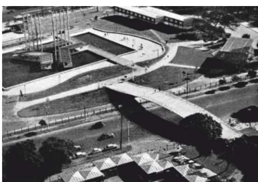
Fig. 8. El puente de César Jannello en su emplazamiento original en la Feria de 1960. (Muzi, C. (2011). A city, a bridge, a chair. On the trail of César Jannello. Art Nexus Magazine, 82)

Sin embargo, en 1974, con el avance de los preparativos para la construcción del Altar de