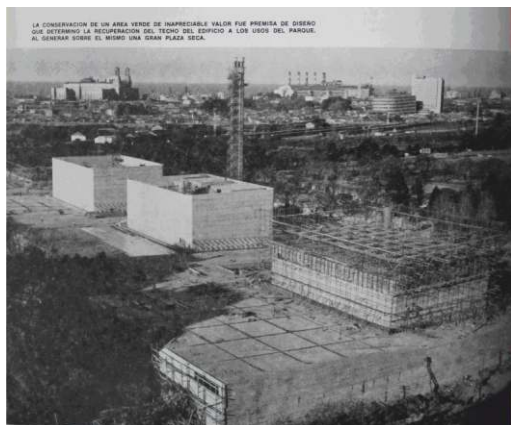
Fig. 1. El edificio del Centro de Producción Buenos Aires en construcción (1977, noviembre-diciembre. Revista Construcciones, 268)

El Centro de Producción Buenos Aires (fig. 1 y 2) había sido levantado en el predio limitado