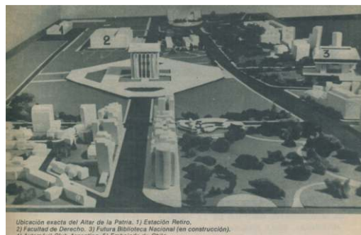
Fig. 3. Maqueta con el emplazamiento del Altar de la Patria sobre la avenida Figueroa Alcorta (1974, abril. Revista Las Bases , 89)

La revista Las Bases 34 publica en abril un artículo: Altar de la Patria: monumento sin tiempo. El altar es comparado en esas páginas con los monumentos más importantes de Europa y se justifica su construcción como símbolo de la recuperación de la unidad