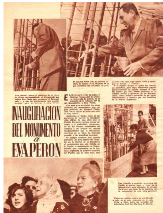
Fig. 6. Inauguración de las obras del Monumento. El presidente J.D. Perón echa la primera cucharada de mezcla en una de las columnas. (1955. Mundo peronista, 86)

Monumento en su memoria que tendría por figura central un descamisado de proporciones colosales y que comenzó a construirse en abril de 1955 (fig. 5 y 6). Luego de descartar la Plaza de Mayo y también la intersección de 9 de Julio y Avenida de Mayo, la decisión había sido finalmente emplazarlo en un predio cercano al Palacio Unzué, en Libertador y Austria, por entonces residencia presidencial y último lugar de descanso de Eva Perón. 42 El proyecto del 74, que ante todo motorizaba el ministro López