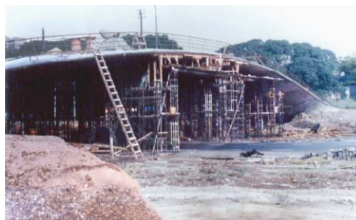
Fig. 9. La reconstrucción del puente de Jannello en su actual ubicación, 1978.

El artículo periodístico que reseñaba su inauguración en mayo de 1978 (fig. 9) recordaba claramente el origen del puente y las razones de su destrucción a manos del gobierno anterior: reconstrucción fiel del realizado en 1960, con motivo de la exposición alusiva a la gesta [de la Revolución de Mayo], y demolido en 1974 por las autoridades de entonces, para emplazar en el lugar un monumento que dio en llamarse Altar de la Patria. 46 No obstante, el discurso del brigadier